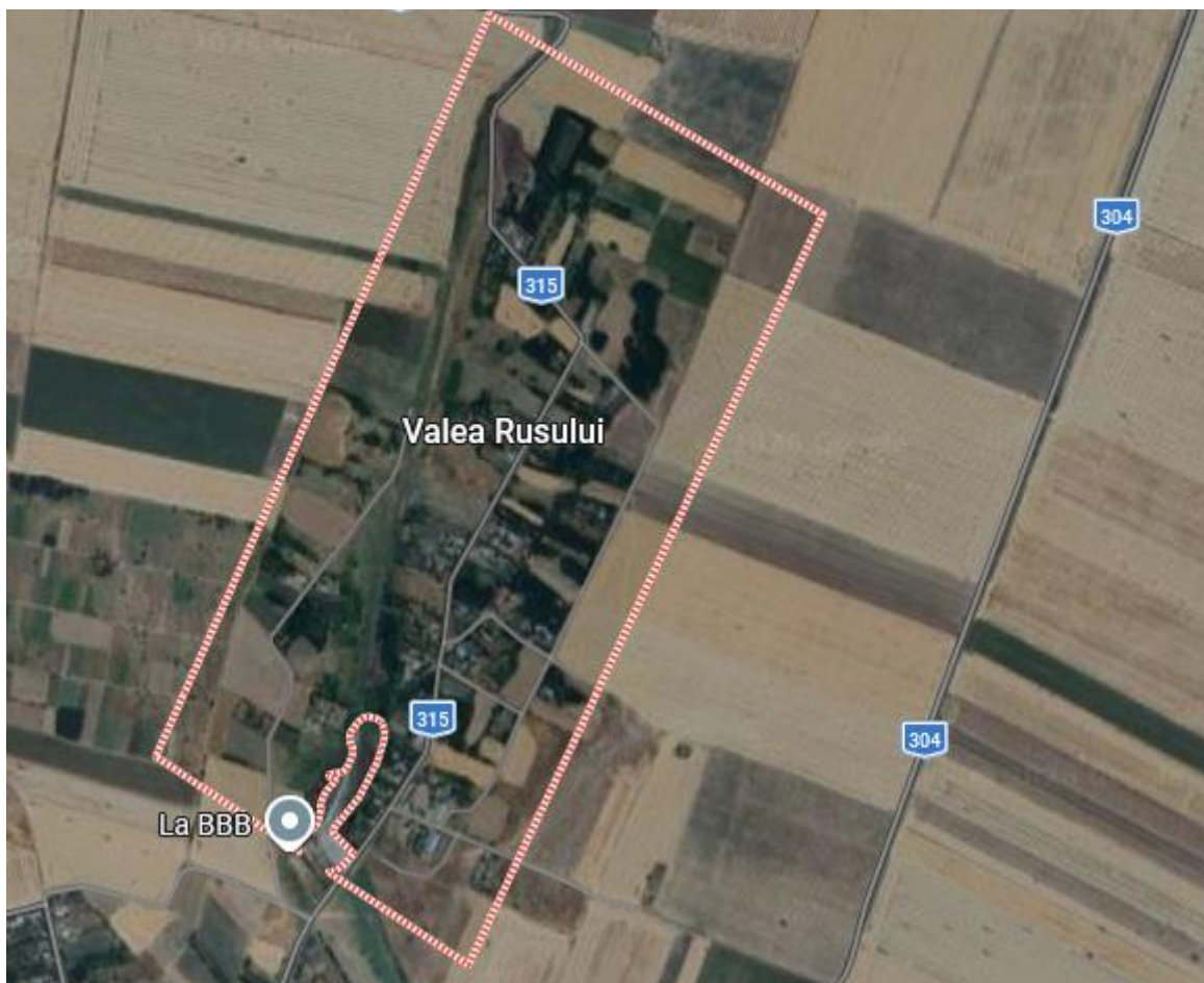
Harta nr 5 – satul Valea Rusului