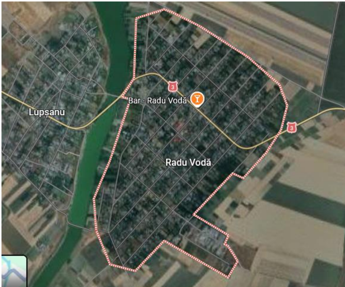
Harta nr 2 – satul Radu Vodă