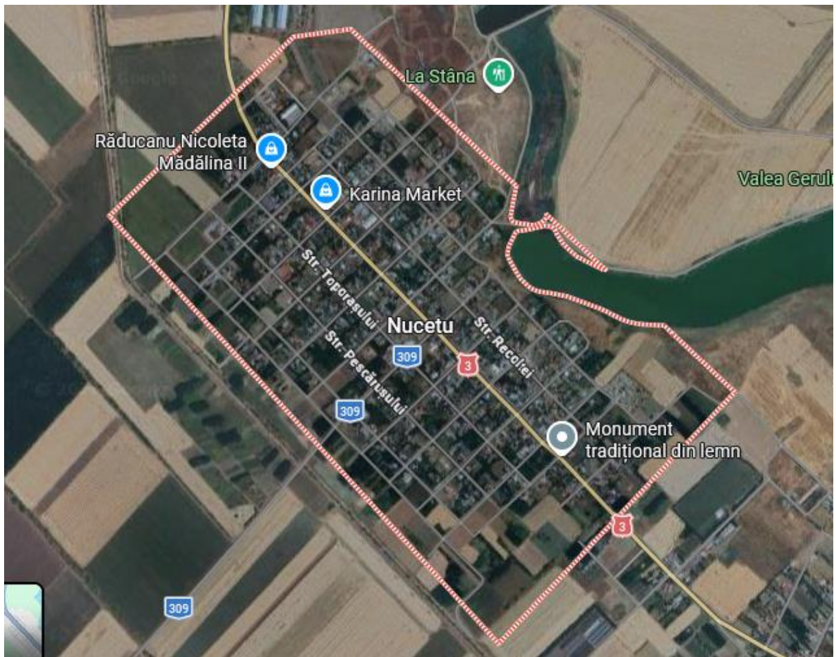
Harta nr 4 – satul Nucetu